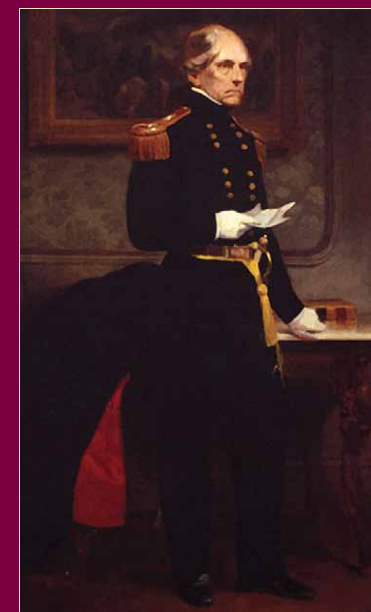
John Ellis Wool by Alonzo Chappel. Wool went on to serve in the Mexican-American War and the Indian Wars in the Oregon Territory. He was the oldest general to serve in the American Civil War.